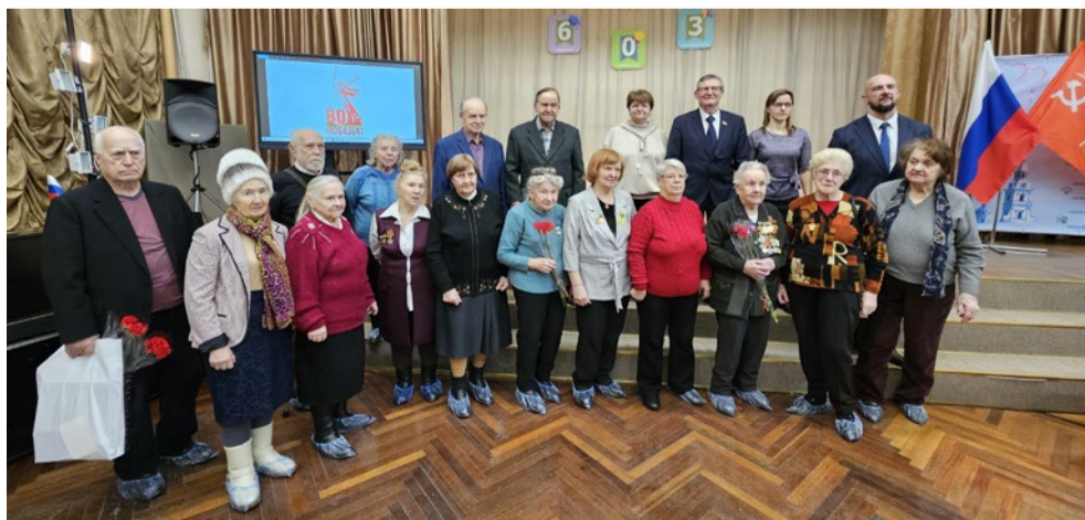
Вручение медалей к 80-летию Великой Победы

В 2025 году депутаты Муниципального Совета совместно с жителями округа принимали участие в патриотических акциях, митингах, шествиях, посвященных Дню памяти и скорби, Дню полного освобождения Ленинграда от фашистской блокады, Дню памяти воинов-интернационалистов и другие.