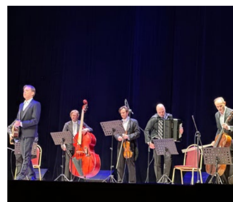
Досуговые и праздничные мероприятия для жителей округа