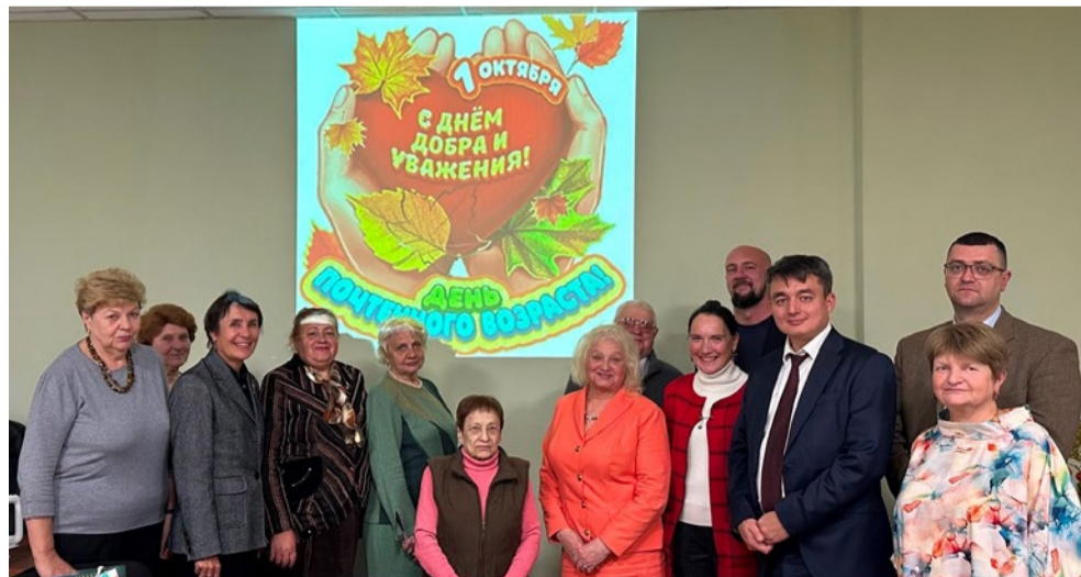
Поздравления трудовых коллективов учреждений