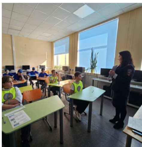
Профилактические мероприятия по безопасности дорожного движения