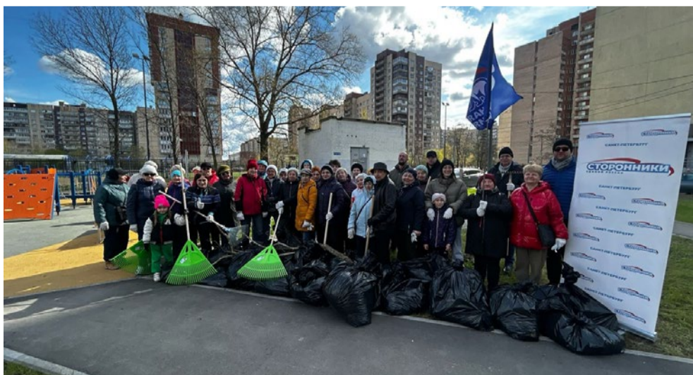
Субботник на территории муниципального образования