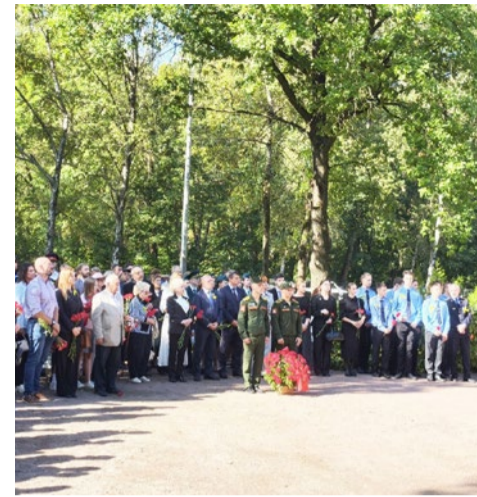
Участие в патриотических акциях

Ведется активная работа по поддержке участников СВО. В сентябре в помещении МС МО Александровский состоялась встреча общественной организации ветеранов «Боевое братство» с активистами Молодежного совета Фрунзенского района, Молодой Гвардии Единой России и Молодежки Народного Фронта. В октябре состоялся круглый стол на тему «Меры поддержки участников СВО и членов их семей» с представителями РОО «Караван» и благотворительного фонда «Караван Надежда». Одно из таких мероприятий прошло в конце декабря, где мы отметили и наградили почетными грамотами самых активных волонтеров, которые принимали участие в сборе гуманитарной помощи для наших защитников в зону СВО, в полевой госпиталь и мирным жителям освобожденных территорий. В Охтинском колледже представители РОО «Караван» совместно с МО Александровский провели урок мужества.