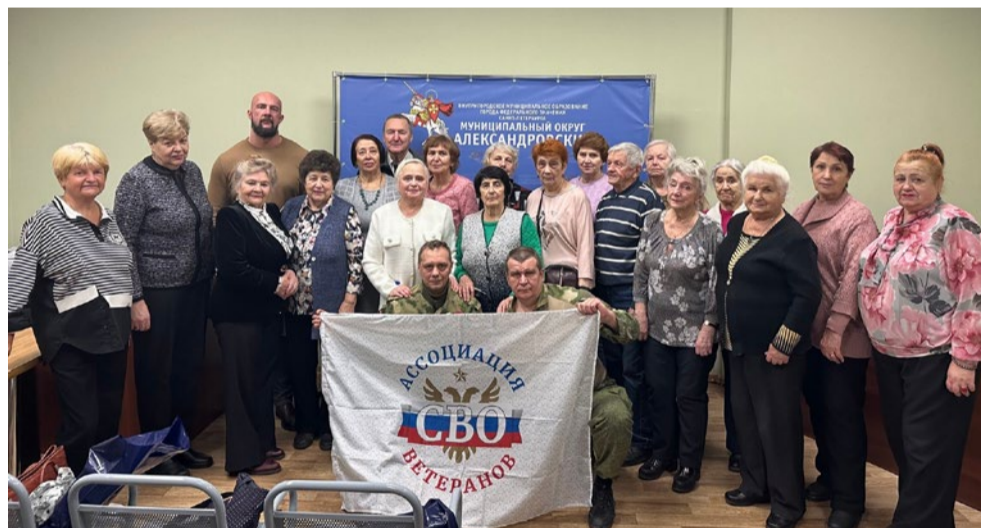
Работа по поддержке участников СВО

Для жителей округа были организованы досуговые мероприятия - спектакли и концерты на театральных площадках Санкт-Петербурга, приуроченные к праздничным датам: Дню полного освобождения Ленинграда от фашистской блокады, Дню Защитника Отечества, Дню местного самоуправления, Празднику Весны и Труда, Дню народного единства, Новому Году.