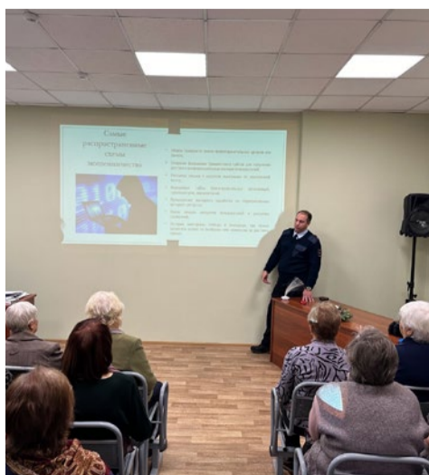
Информационно - просветительские мероприятия «Как защититься от мошенников»