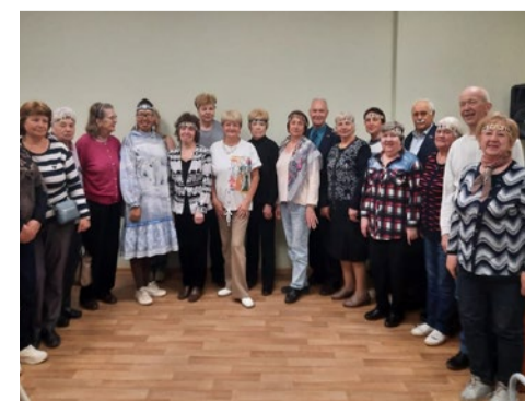
Мероприятия по укреплению межнационального согласия