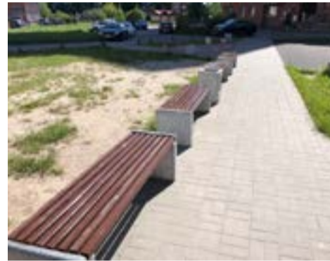
г. Санкт-Петербург, Бухарестская улица, дом 118, корпус 3, литера А