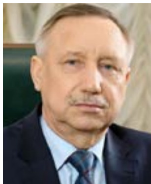
Александр БЕГЛОВ, губернатор Санкт-Петербурга

На примере участка 49, в школе № 564 на улице Егорова, Горизбирком показал, как будет проходить голосование по поправкам в Конституцию согласно всем рекомендациям Роспотребнадзора.