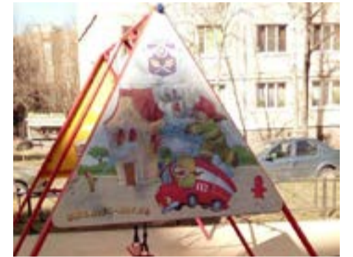
г. Санкт-Петербург, Малая Бухарестская улица, дом 11/60, литера А